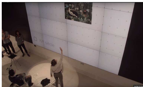
L'équipe lauréate de l'événement API(dot)ART, qui a présenté le projet Vie-Trouve : un système de recherche dans le fonds par le mouvement