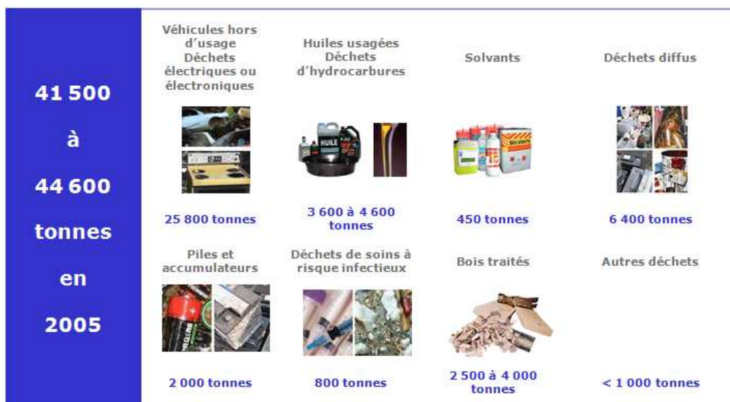
Figure 2. Les gisements de déchets dangereux guadeloupéens en 2005

Le gisement de déchets dangereux a été estimé à près de 43 000 tonnes pour l'année 2005 3 .