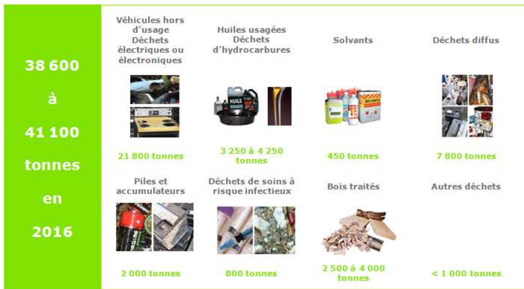
Figure 3. Perspective d'évolution des déchets dangereux à l'horizon 2016