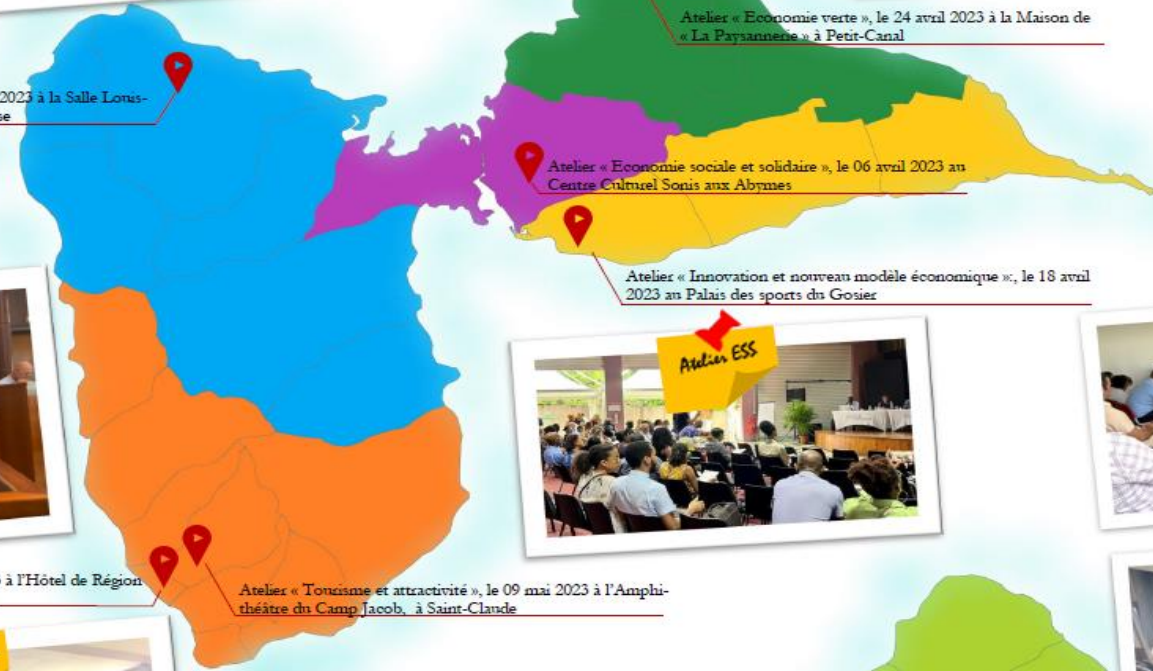
Atelier « Economie sociale et solidaire », le 06 avril 2023 au Centre Culturel Sonis aux Abymes