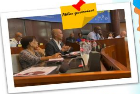
Atelier « Gouvernance », le 31 mai 2023 à l'Hôtel de Région à Basse-Terre